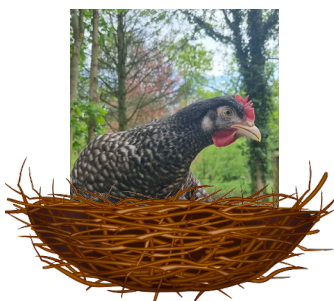
Tizoute Coucou Rennes