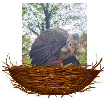
Noisette Cream Legbar